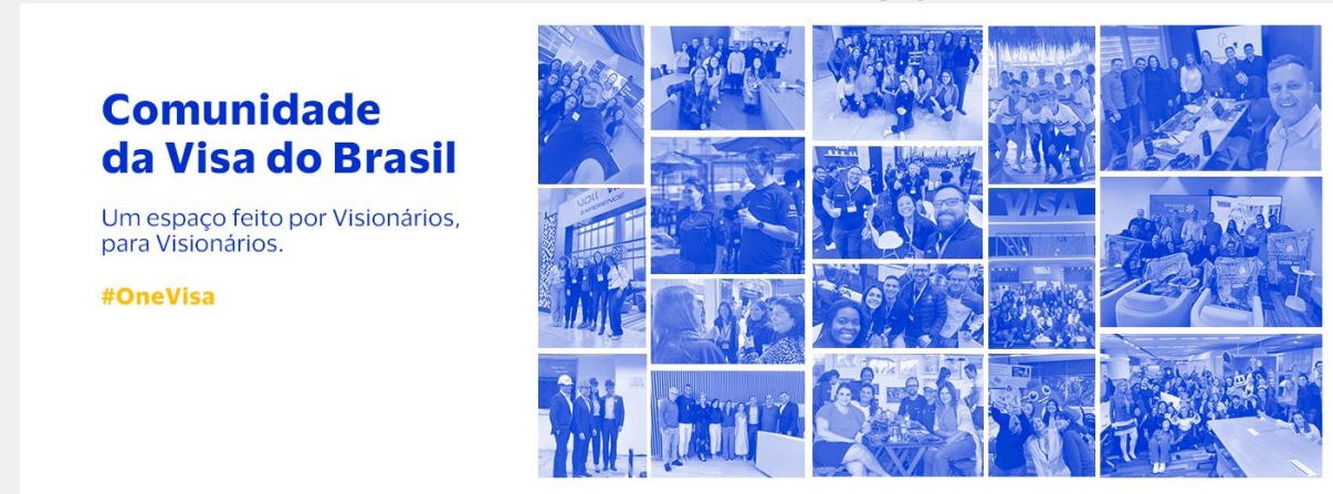
Capa da plataforma do Viva Engage

O Viva Engage é uma plataforma da Microsoft para comunicação e engajamento interno de funcionários dentro de organizações. Funciona como uma rede social onde as pessoas e o perfil oficial da empresa podem fazer suas postagens.