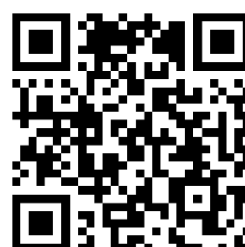
Carne bovina Reels 1 / 2 / 3