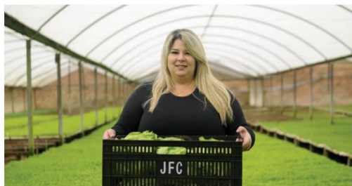
Iniciativa é mais um passo do McDonald's para acabar com mitos sobre sua cozinha

Série de filmes mostrará toda a cadeia de produção da rede de fast food e busca desmistificar questões em torno de seus ingredientes