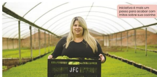
Iniciativa é mais um passo para acabar com mitos sobre sua cozinha