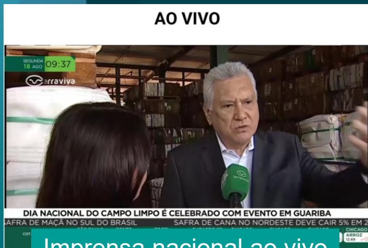
Imprensa nacional ao vivo