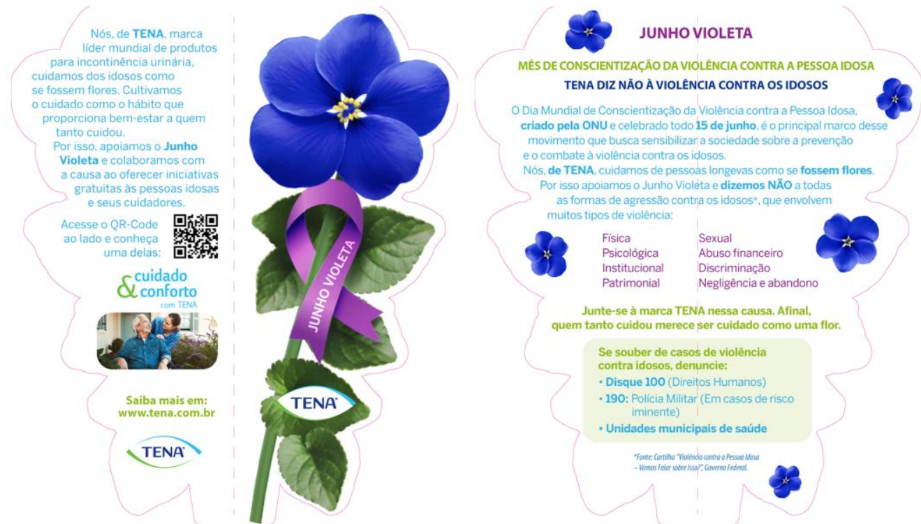
IMAGEM: reprodução do arquivo do flyer em formato de flor com marcas de corte. À esquerda: frente e verso do arquivo para impressão; à direita o miolo do material para impressão. Uma vez impresso, ao dobrar na linha pontilhada, o material toma o formato semelhante ao de uma flor. Foram entregues 1.000 (mil) flyers ao longo da ação.

Os promotores foram instruídos para, ao entregar o flyer, explicar o objetivo da campanha e esclarecer sobre os tipos de violência, previstos na cartilha “Violência Contra a Pessoa Idosa”, do Governo Federal.