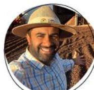
Café no Brasil