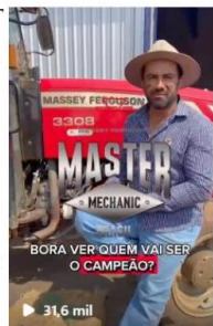
Café no Brasil® (@cafenobrasil)