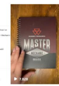
Ligia Bronholi Pedrini (@ligiapedrini)