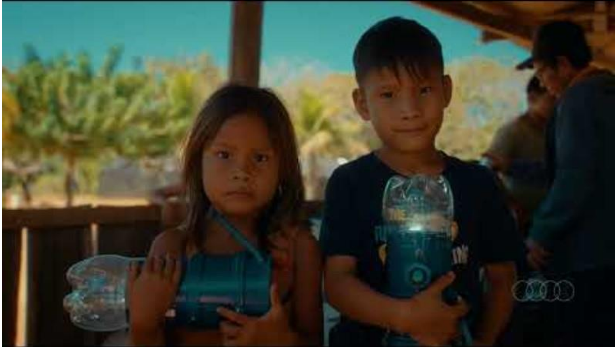
Audi - Litro de Luz - YouTube