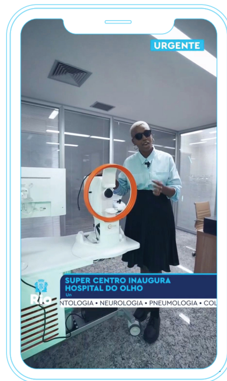
VÍDEO ATENÇÃO! O Plantão da Pref revela TUDO (10/02/23)