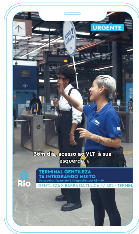
VÍDEO Plantão da Pref no Terminal Gentileza 2 (03/07/24)