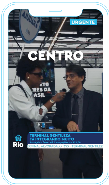
VÍDEO URGENTE: Terminal Gentileza tá integrando muito (27/06/2024)

O vídeo tem uma abertura dramatizada, com som de trombetas e o estandarte da Prefeitura do Rio de Janeiro surgindo em ângulos diversos na tela, como se fosse a chamada do "Plantão da Globo". No topo da tela, a palavra "urgente" fica pulsando para prender a atenção do espectador. Os diversos tons de azul utilizados no lettering, roupa da apresentadora e créditos do vídeo, que remetem à cor oficial da Prefeitura, facilitam a identificação do conteúdo como sendo oficial das contas do município. Mas, quem não é familiarizado com os posts publicados nas redes da Prefeitura do Rio, poderia não perceber de que se tratava de um conteúdo feito pela municipalidade, visto que a linguagem é bastante diferente e mais solta do que o que usualmente é produzido.