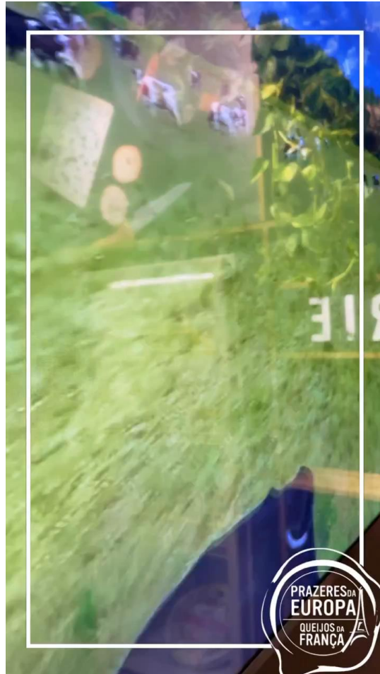
Super Rio Expofood