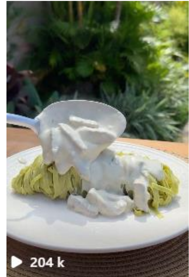
Receita com Cozinha para Dois