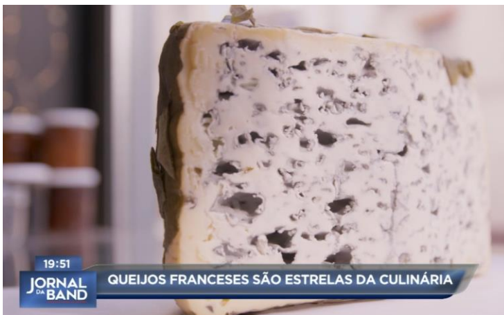
Jornal da Band