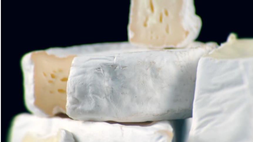
Eterno enquanto Cure – Dudu Prado