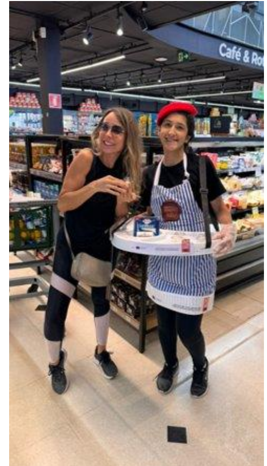
Degustações em Pontos de Vendas