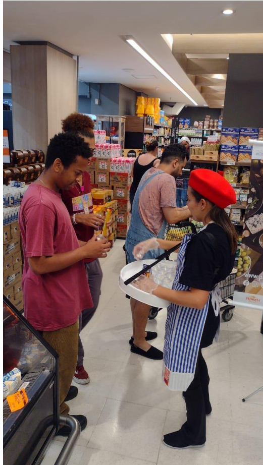
Degustação em Pontos de Venda