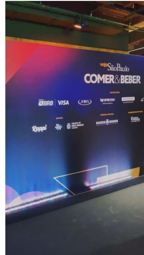
Prêmio Veja Comer & Beber