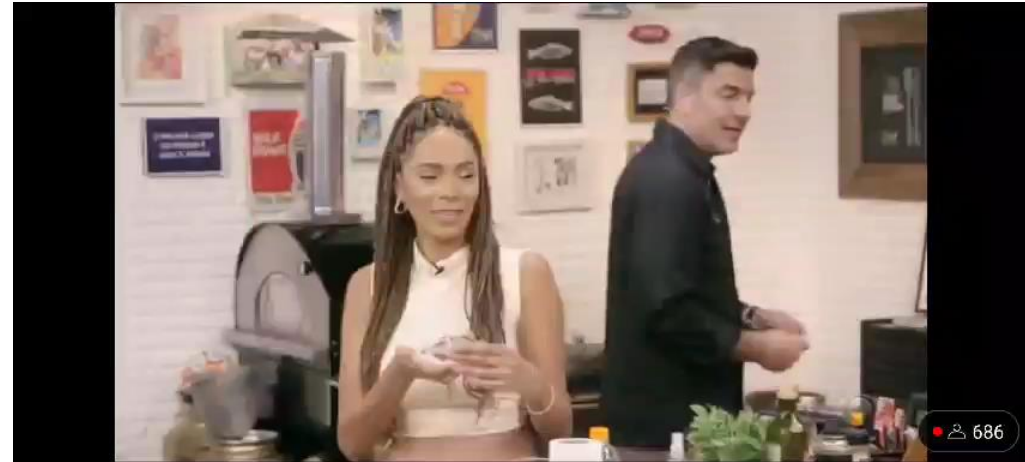
The Chef - Edu Guedes