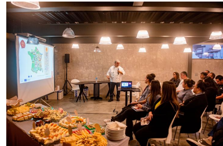
Reunião com os Importadores