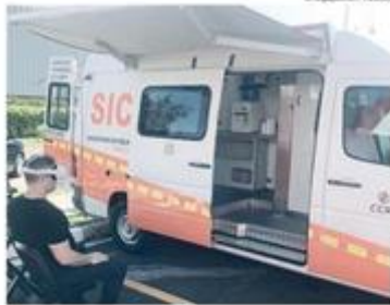
O veículo disponibiliza diversos recursos para os moradores se informarem sobre as obras

A concessionária da rodovias CCR ViaOeste iniciou na quarta-feira, dia 28/6, um cronograma de ações com o Serviço de Atendimento ao Cliente (SIC) em pontos estratégicos e de fácil acesso para a população de Barueri. O objetivo da iniciativa é apresentar as obras que estão sendo executadas pela concessionária na rodovia Castello Branco, bem como tirar dúvidas da população sobre tais ações.