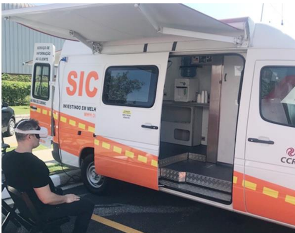
O veículo disponibiliza diversos recursos para os moradores se informarem sobre as obras