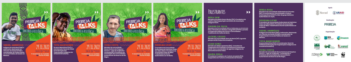
Carrossel para redes sociais Divulgado em 23/11