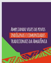
Card animado para redes sociais Divulgado em 24/11