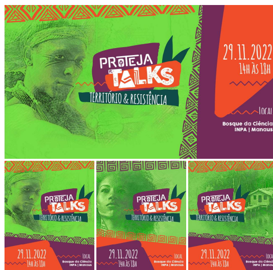
Imagens de aprovação da Identidade Visual