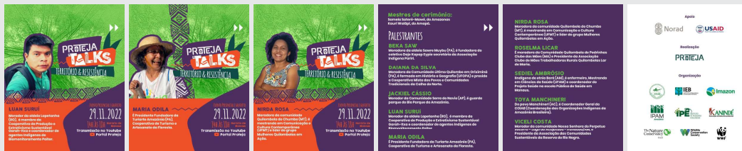
Carrossel para redes sociais Divulgado em 22/11