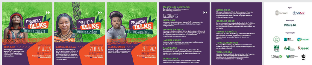
Carrossel para redes sociais Divulgado em 21/11