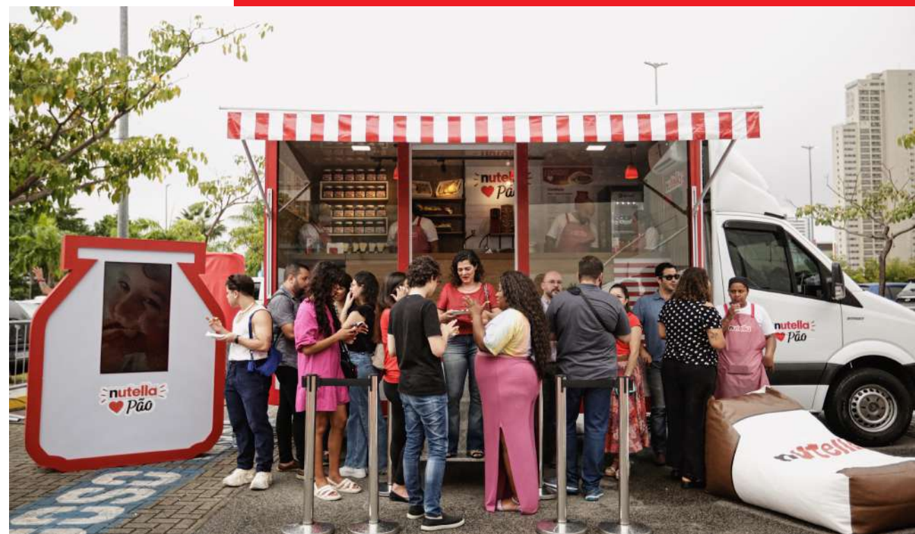
Padaria móvel instalada nas dependências do RioMar Shopping, em Recife.