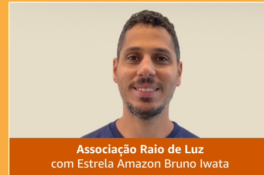
Associação Raio de Luz com Estrela Amazon Bruno Iwata