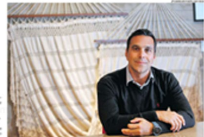
CRÉDITO: T. Trindade, CEO do Airbnb para América Latina

■ Como está a retomada do Airbnb no Brasil? Trindade: "No nível pré-pandemia no segundo trimestre deste ano. Depois de quase 12 meses com as pessoas vibrando uma vida impactada pela covid, as pessoas sentem que é hora de fazer viagens com o progresso da vacinação. Elas querem fazer uma experiência com lugares, amigos, com uma rotina um pouco mais livre, menos restrita. Vimos nesse período que o Airbnb foi parte de solução. As observações baseadas em dados de países, nos ajudam de segundo semestre e vamos para o futuro".