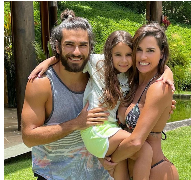
Link para a foto no Instagram

Todo o conteúdo estava também conectado às mensagens-chave da marca e contou com link de acesso à página do Airbnb, a hashtag #AirbnbParaReconectar e a marcação do perfil oficial da empresa no Instagram.