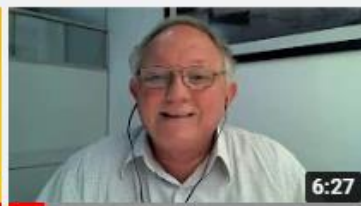
Como é feito o controle de qualidade da água que...