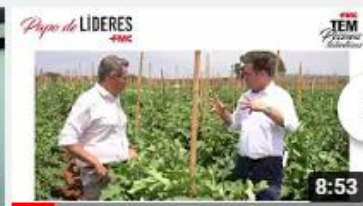
Papo de Líderes