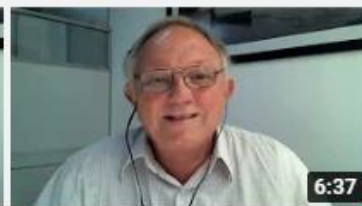
Como é feito o controle de qualidade da água que...