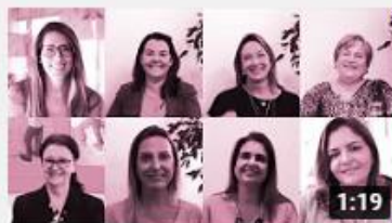
Vídeo 1: Força da Mulher no Campo