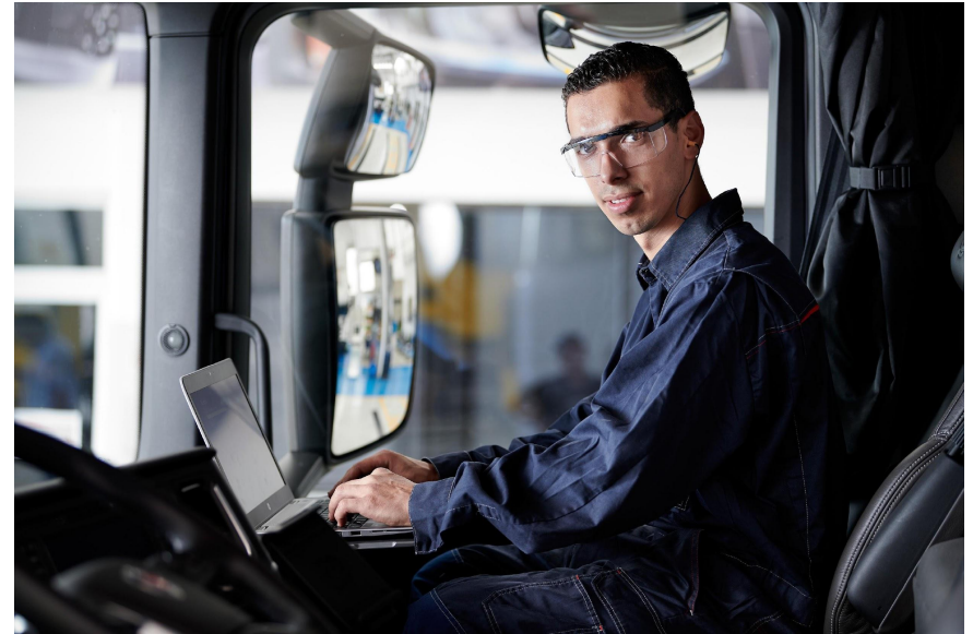
Extraindo inteligência de cada informação

https://www.scania.com/br/pt/home/products-and-services/connected-services.html