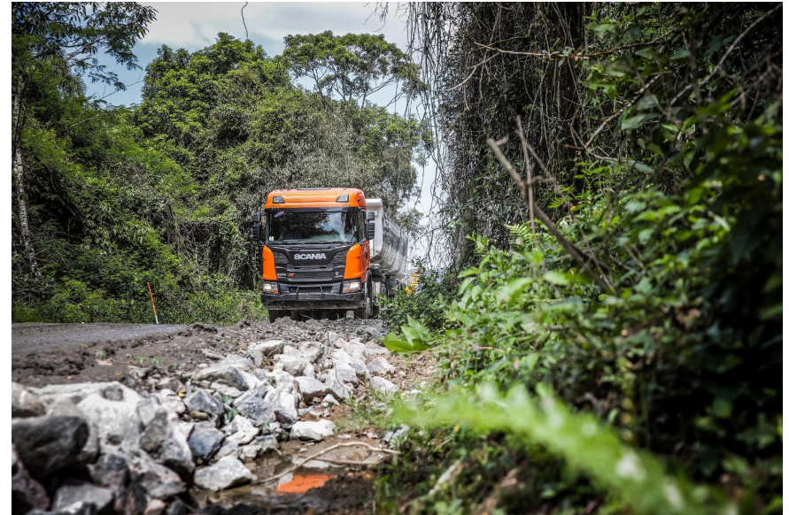
Sustentabilidade do planeta e do seu negócio

Nosso comprometimento é com um futuro melhor. A missão de liderar a transformação para um mundo dos transportes mais sustentável passa por uma série de etapas, que envolvem a redução de emissão de gases poluentes, mas também a criação de soluções e alternativas que sejam rentáveis para os nossos clientes. Entendemos o seu negócio e o que é necessário para continuar sua operação. É por isso que concentramos nossos esforços para que você possa acompanhar a gente nessa jornada. #ScaniaBrasil