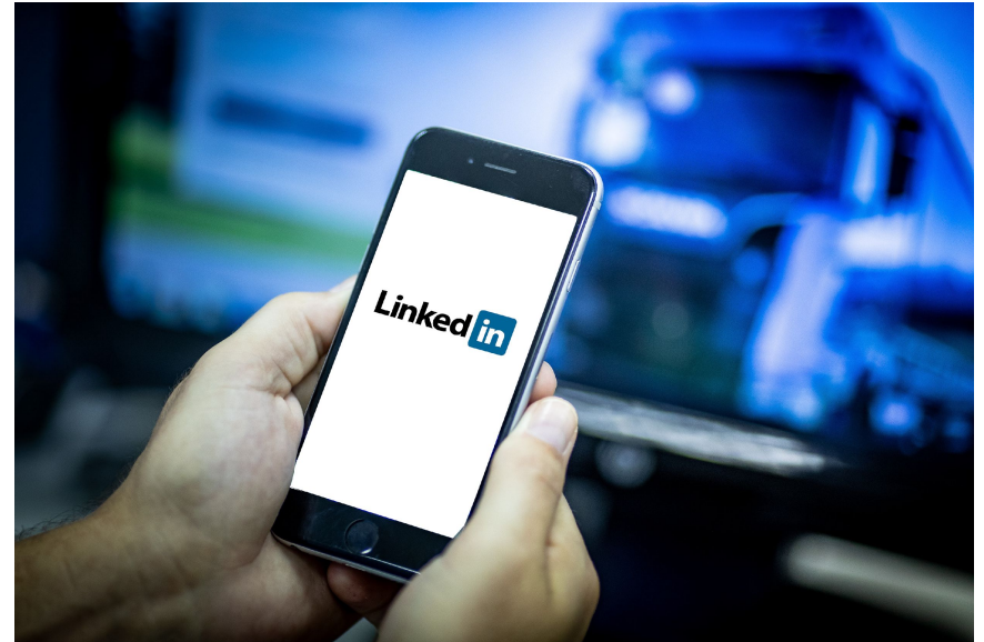
Scania Brasil agora no LinkedIn

Seja bem-vindo à página da Scania Brasil no LinkedIn! Hoje iniciamos mais um canal oficial da marca, que já está presente nas principais redes sociais, para conversar com você, profissional do transporte. Acompanhe todas as nossas novidades e participe da jornada rumo a um mundo dos transportes mais sustentável! #ScaniaBrasil