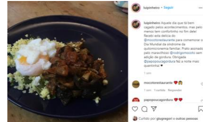
Sérgio Timermann @dr.sergiotimerman