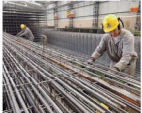
Expansão industrial da Gerdau em Minas Gerais.

Com o anúncio de investimentos de R$ 6 bilhões em Minas Gerais, a Gerdau reforça seu compromisso com o desenvolvimento econômico do Estado. O grupo investirá em três eixos principais: expansão, modernização e adoção de práticas ambientais e sociais.