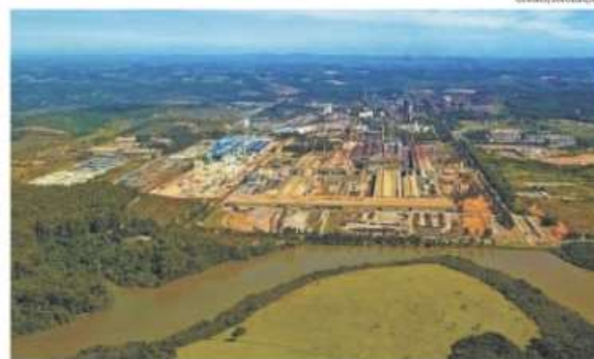
Planta de Ouro Branco concentra parte dos aportes que devem gerar 6 mil empregos diretos e indiretos

"Esse novo plano de investimentos representa um importan-