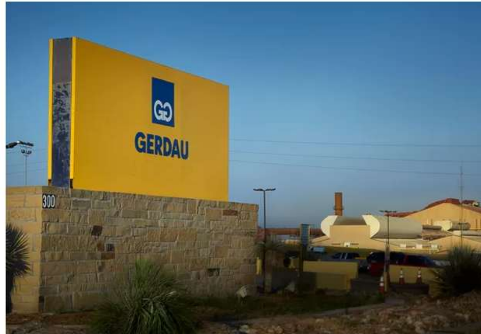
Gerdau vai investir R$6 bi nos próximos 5 anos em MG