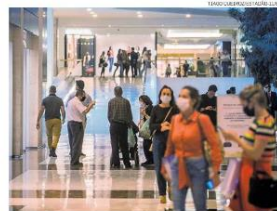
Passelo. Movimento no corredor do Shopping Iguaçu

O movimento foi um pouco maior no Shopping Center Norte, na Vila Guilherme, zona norte. Ali, os corredores estavam cheios, mas poucas pessoas com sacolas nas mãos. “Não estava planejado a gente vir aqui,